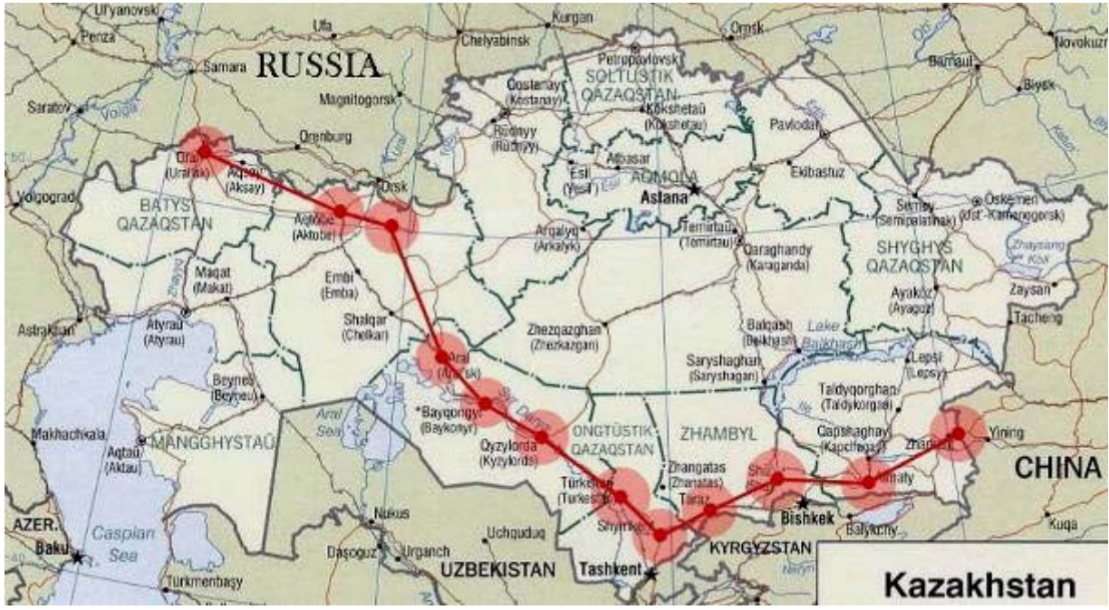
Модель и зоны обслуживания региональных транспортно-логистических центров международного транзитного коридора «Западная Европа – Западный Китай»